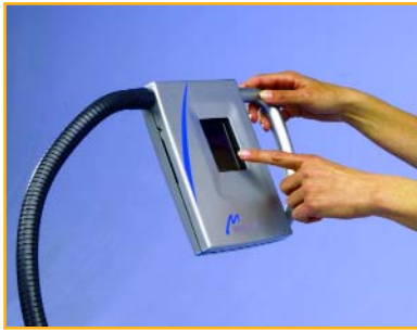
Пульт управления бесконтактной гидромассажной ванной с цветным сенсорным дисплеем