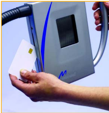
На чип-карте можно сохранять индивидуальные параметры массажа для дальнейшего многократного использования

цепторов восходящие импульсные потоки стимулируют термосенсорные структуры головного мозга, вызывая перераспределение сосудистого и мышечного тонуса. Изменяется вегетативная регуляция висцеральных функций. Происходят расширение сосудов «оболочки», гиперемия кожи и нарастание кровотока в ней с 0,2–0,5 до 4,8 л·мин -1 (при 40° С). Кроме того, тепловой фактор ванн приводит к усилению тормозных процессов в коре головного мозга.