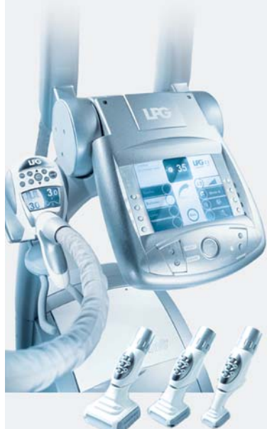
Cellu M6 KEYMODULE